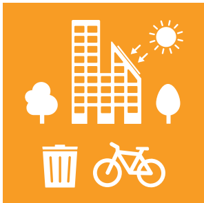
Mål 11 Bæredygtige byer og lokalsamfund

11.6 Inden 2030 skal den negative miljøbelastning pr. indbygger reduceres, herunder ved at lægge særlig vægt på luftkvalitet og på husholdnings- og anden affaldsforvaltning.