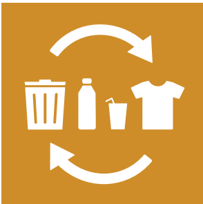
Mål 12 Ansvarligt forbrug og produktion

12.5 Inden 2030 skal affaldsgenereringen væsentligt reduceres gennem forebyggelse, reduktion, genvinding og genbrug.