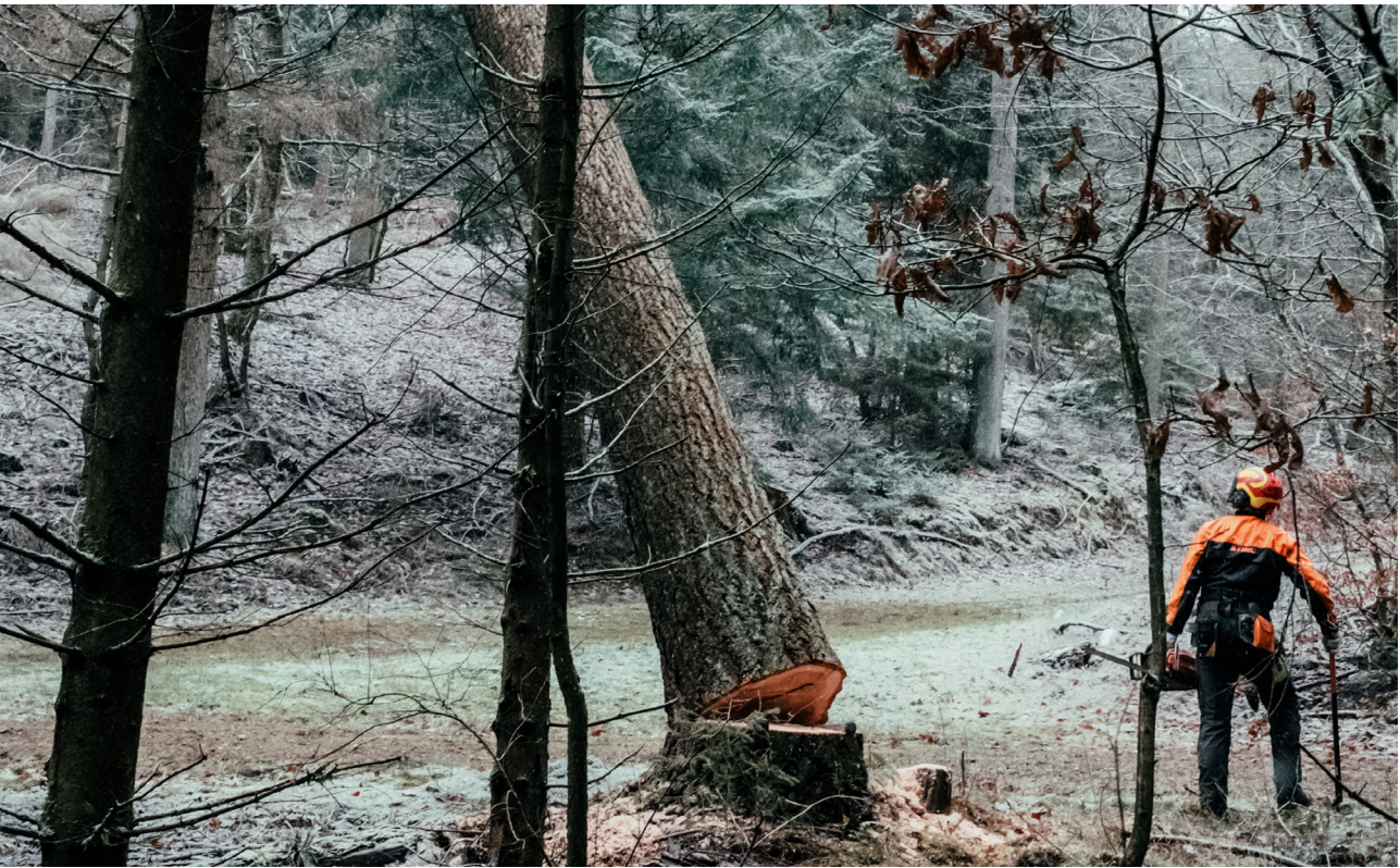
Den første douglasgran til byggeriet af Håndværkskollegiet i Horsens fældes i FSC-certificeret statsskov.

Jyske Bank er medlem af UNGC og publicerer en selvstændig Communication on Progress rapport. BRFfonden agerer som aktiv ejer i forhold til Jyske Bank med henblik på at fremme ansvarlig og bære- dygtig bankdrift. Læs mere på side 27.