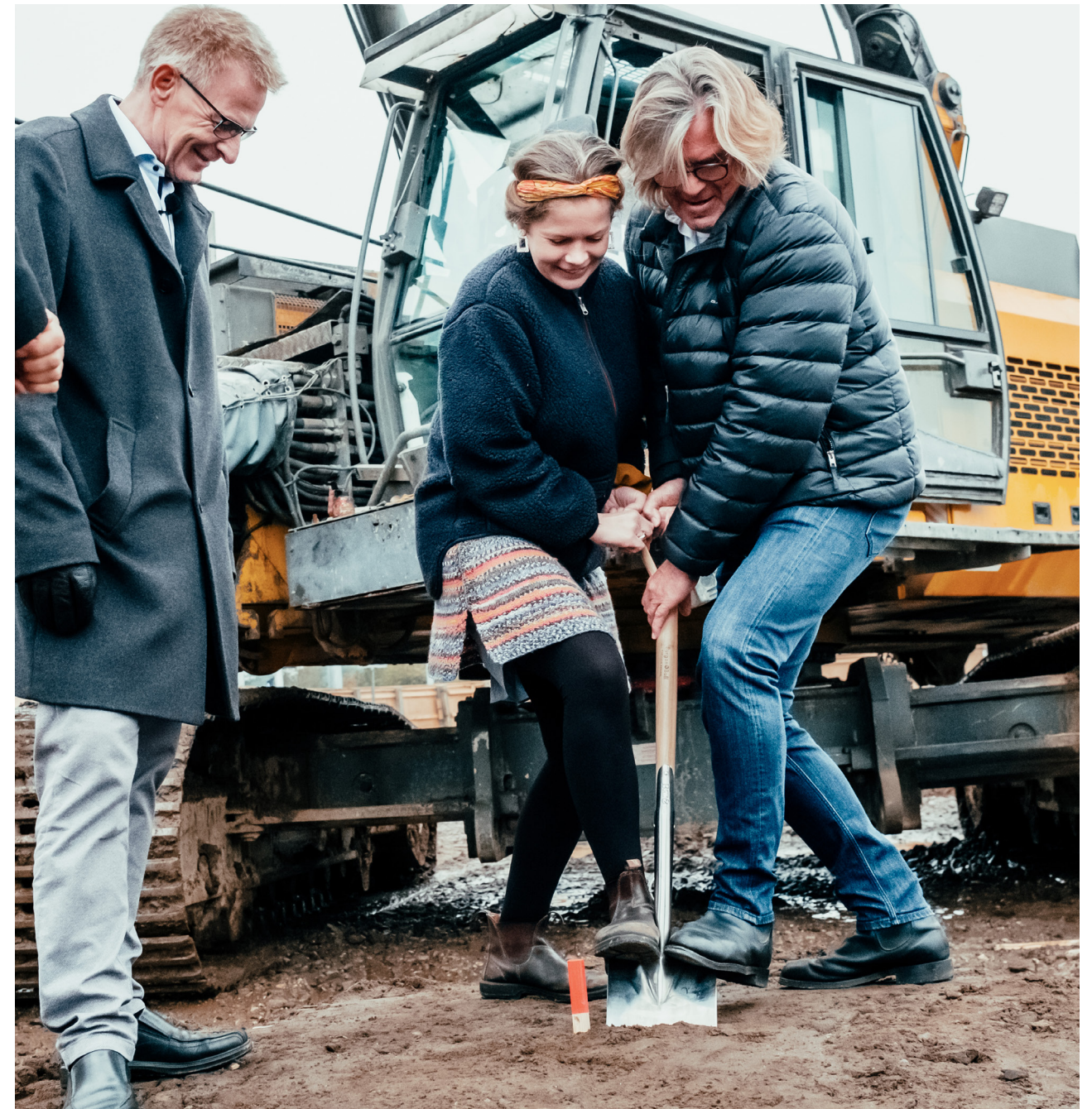
Mandag d. 25. oktober 2021 — Det første spadestik bliver taget til byggeriet af Håndværkskollegiet i Horsens.