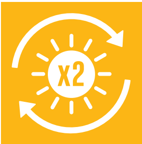
Mål 7 Bæredygtig energi

7.3 Inden 2030 skal den globale hastighed for forbedring af energieffektiviteten fordobles.