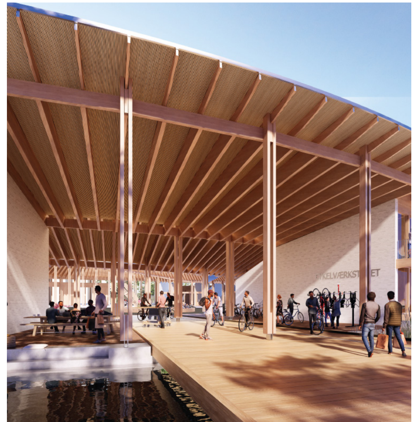
Indgangene til Håndværkskollegiet i Herning skal med åbenhed byde folk ind i bygningens gårdrum, der skal fungere som samlingspunkt for beboere og brugere af kollegiet. Kilde: Dorte Mandrup Arkiteter.

Håndværkskollegiet i Herning skal forbinde Herningholms Erhvervsskoler og Gymnasier med Lillelund Engpark og samtidig skabe forbindelse til bymidten gennem sportsbanerne. Med sin åbne arkitektur skal kollegiet give forbipasserende et naturligt indblik i aktiviteterne i værkstederne.