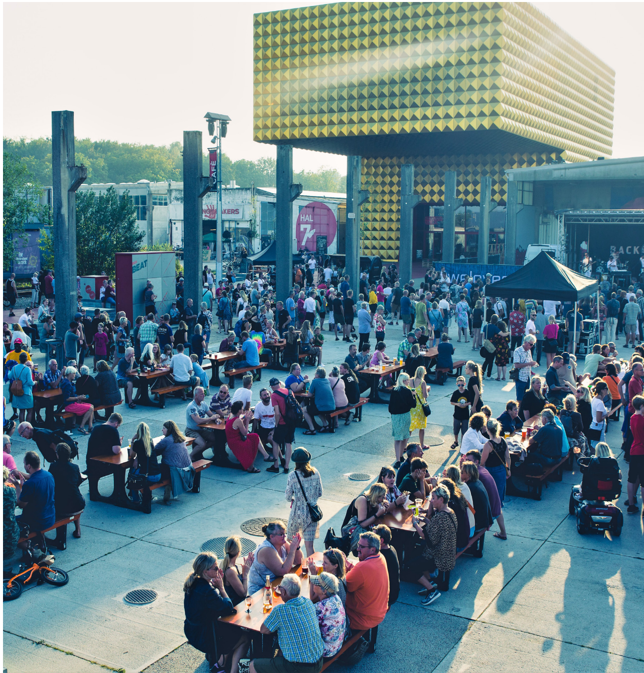
Rabalder-festival 2019 i Musicon-bydelen arrangeret af Foreningen af Aktører på Musicon.