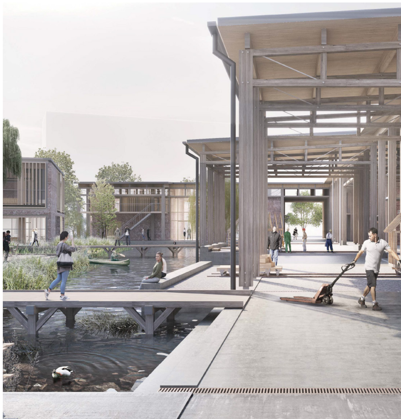
Regnvandsbassinet i midten af byggeriet skal fungere som naturlig afgrænsning mellem kollegieboliger og værksteder og på samme tid fungere som et samlingspunkt for Håndværkskollegiets beboere og brugere.